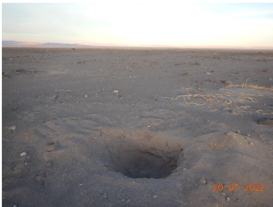
Figura 1-41. Fotografía punto de monitoreo L4-3 campaña Trimestre 3 año 2022.