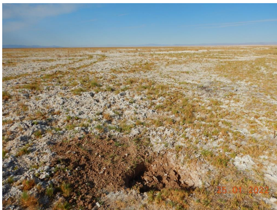
Figura 1-18. Fotografía punto de monitoreo 1027 campaña Trimestre 1 año 2022.