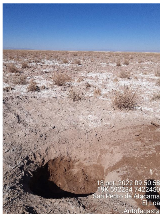
Figura 1-70. Fotografía punto de monitoreo L7-14 campaña Trimestre 4 año 2022.