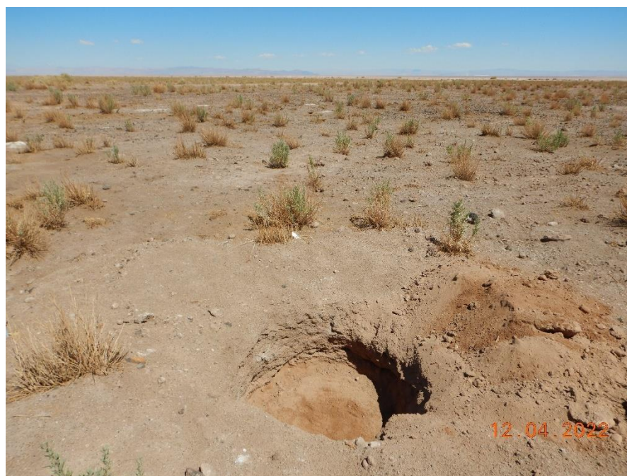
Figura 1-30. Fotografía punto de monitoreo L2-26 campaña Trimestre 2 año 2022.