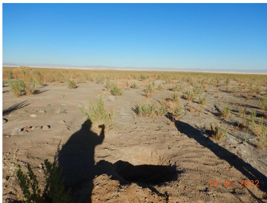
Figura 1-26. Fotografía punto de monitoreo L3-3 campaña Trimestre 2 año 2022.