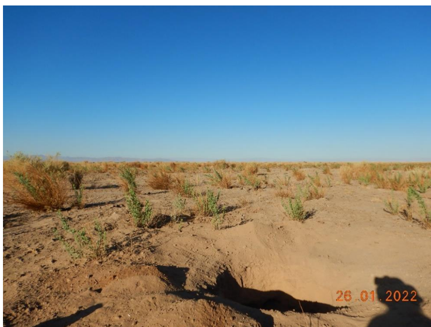
Figura 1-2. Fotografía punto de monitoreo L9-2 campaña Trimestre 1 año 2022.