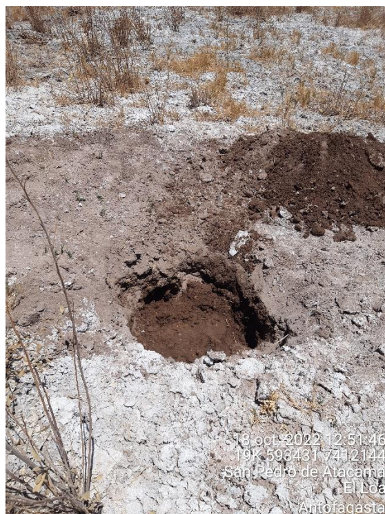
Figura 1-69. Fotografía punto de monitoreo L2-27 campaña Trimestre 4 año 2022.

Fuente: Registro Fotográfico terreno, octubre 2022