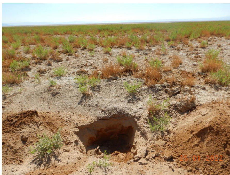
Figura 1-7. Fotografía punto de monitoreo L5-6 campaña Trimestre 1 año 2022.