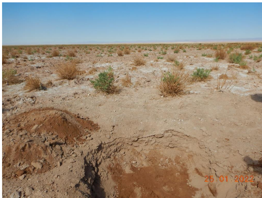
Figura 1-16. Fotografía punto de monitoreo L7-14 campaña Trimestre 1 año 2022.