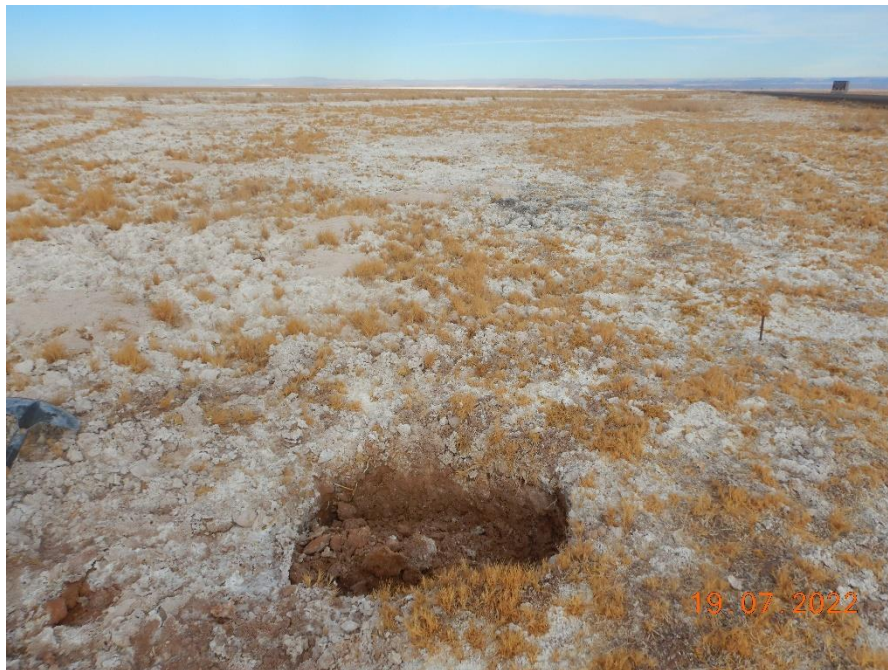
Figura 1-54. Fotografía punto de monitoreo 1027 campaña Trimestre 3 año 2022.