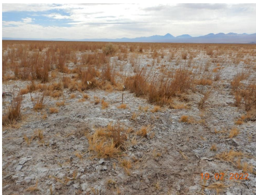
Figura 1-51. Fotografía punto de monitoreo L2-27 campaña Trimestre 3 año 2022.