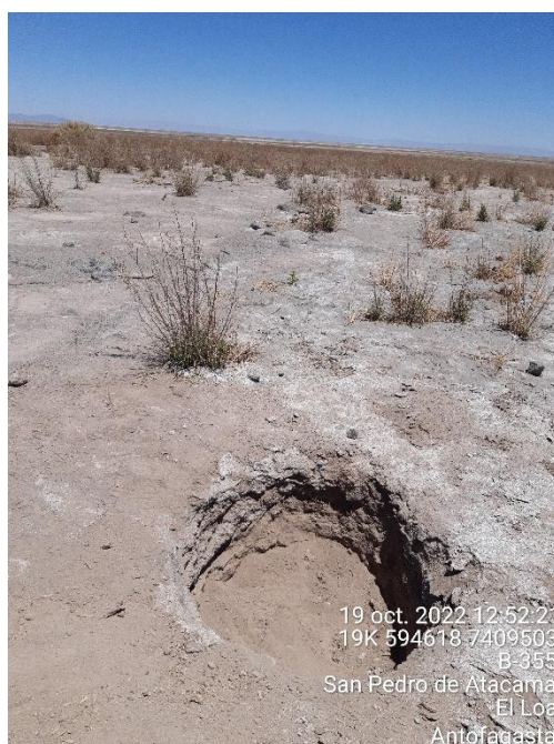
Figura 1-62. Fotografía punto de monitoreo L3-3 campaña Trimestre 4 año 2022.