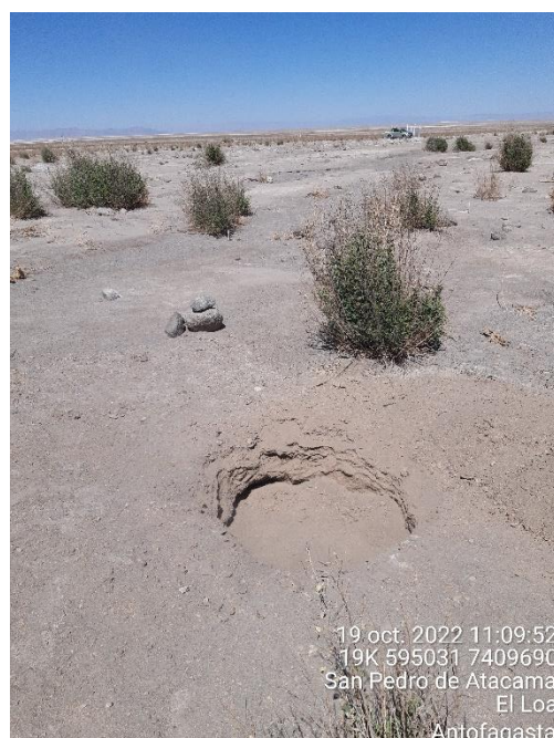
Figura 1-60. Fotografía punto de monitoreo L3-15 campaña Trimestre 4 año 2022.