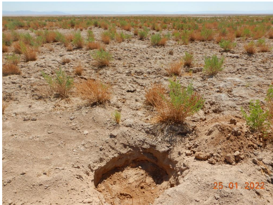
Figura 1-4. Fotografía punto de monitoreo L4-17 campaña Trimestre 1 año 2022.