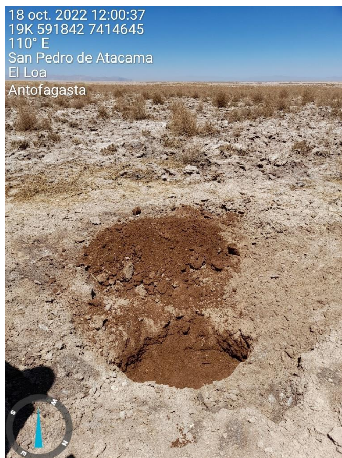
Figura 1-68. Fotografía punto de monitoreo L2-4 campaña Trimestre 4 año 2022.