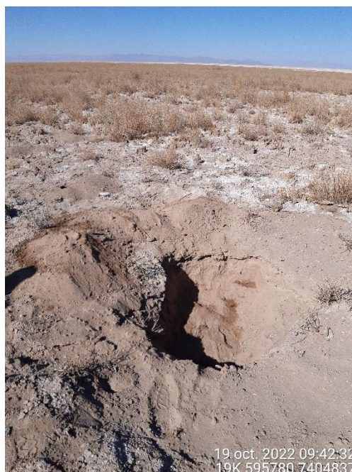
Figura 1-61. Fotografía punto de monitoreo L5-6 campaña Trimestre 4 año 2022.