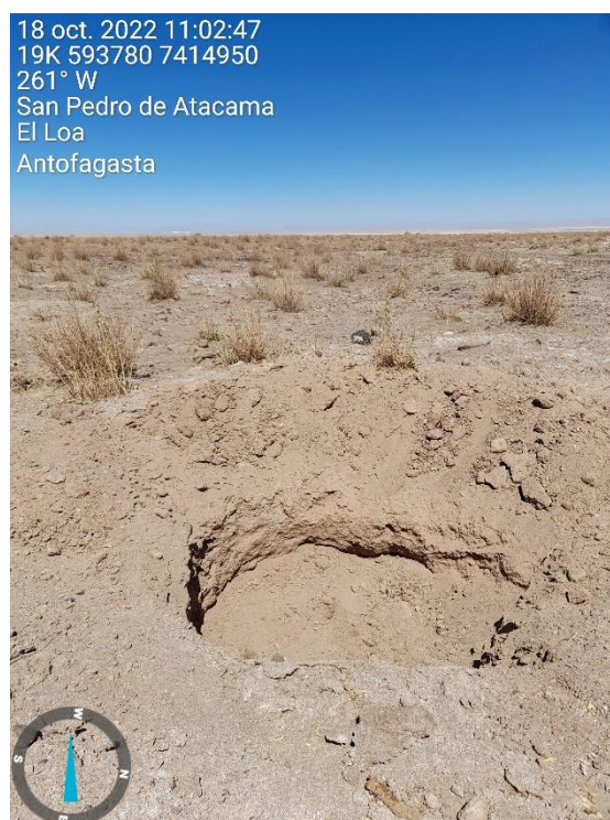
Figura 1-66. Fotografía punto de monitoreo L2-26 campaña Trimestre 4 año 2022.