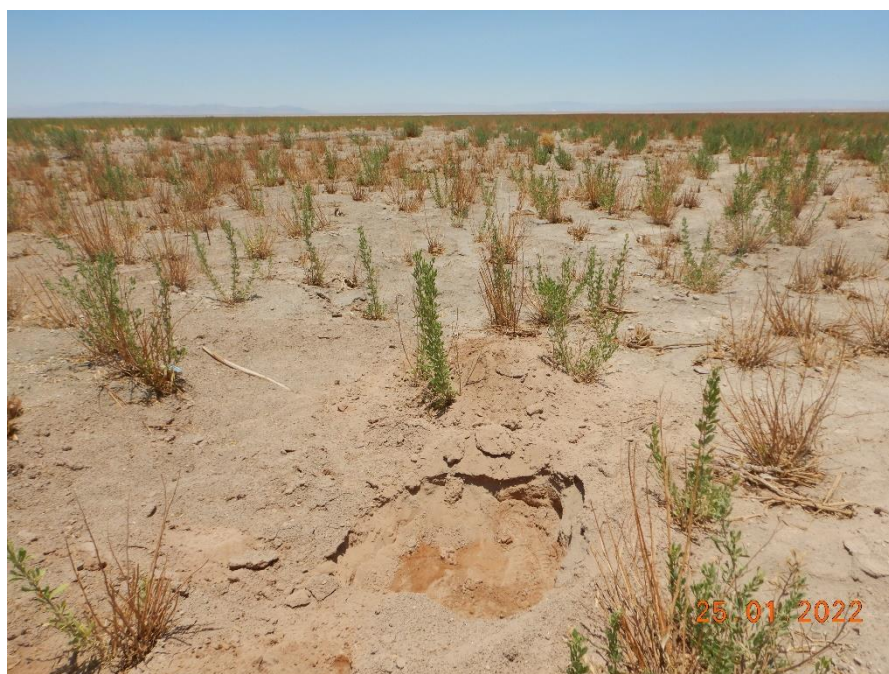
Figura 1-11. Fotografía punto de monitoreo L2-28 campaña Trimestre 1 año 2022.

Fuente: Registro Fotográfico terreno, enero 2022