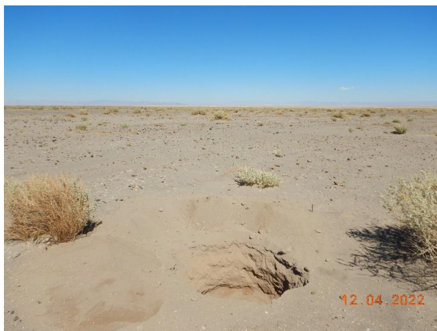
Figura 1-28. Fotografía punto de monitoreo L1-3 campaña Trimestre 2 año 2022.