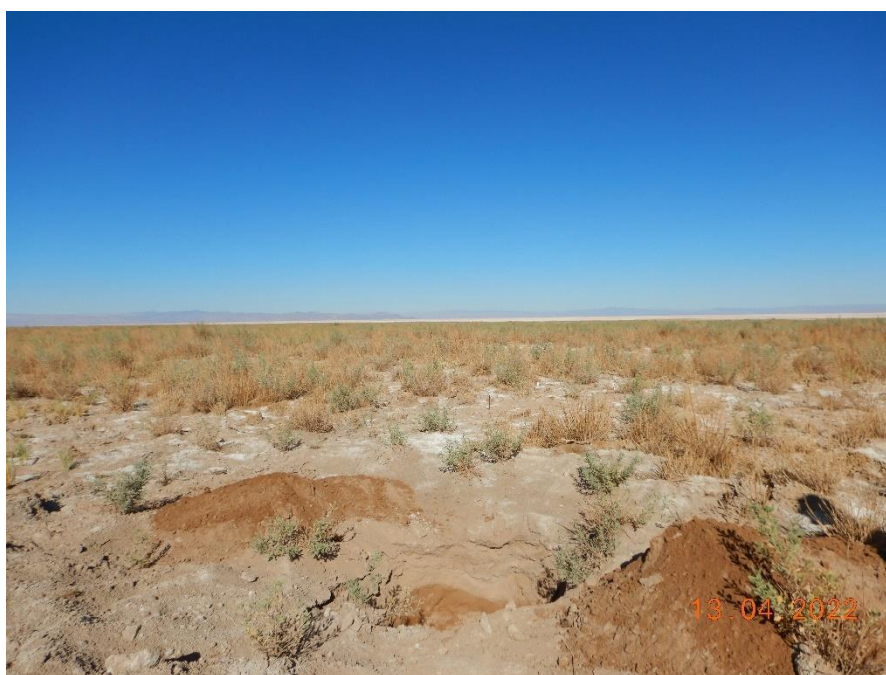
Figura 1-25. Fotografía punto de monitoreo L5-6 campaña Trimestre 2 año 2022.