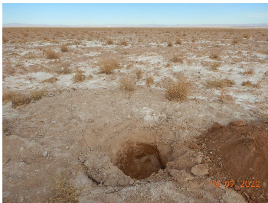
Figura 1-52. Fotografía punto de monitoreo L7-14 campaña Trimestre 3 año 2022.