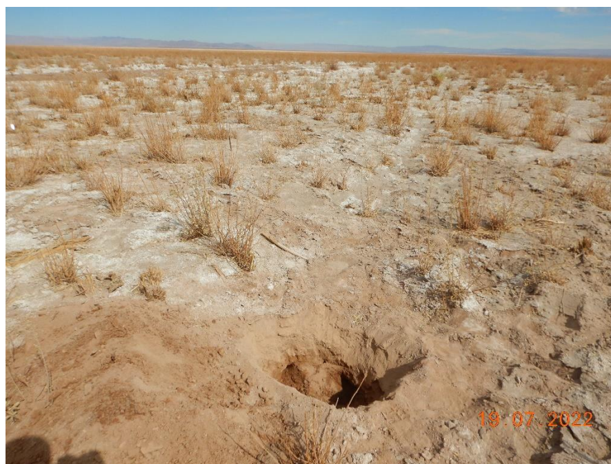
Figura 1-47. Fotografía punto de monitoreo L2-28 campaña Trimestre 3 año 2022.