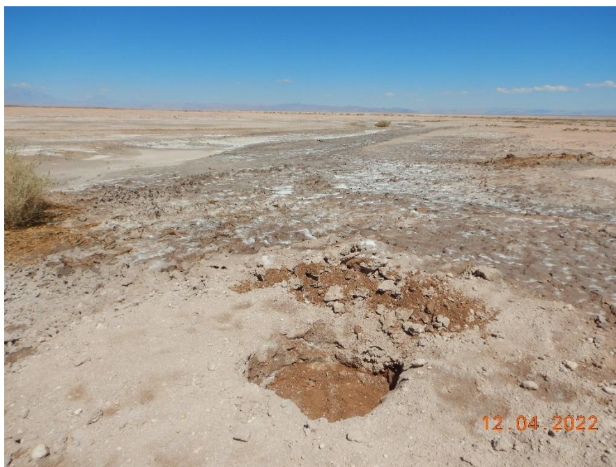
Figura 1-31. Fotografía punto de monitoreo L2-25 campaña Trimestre 2 año 2022.