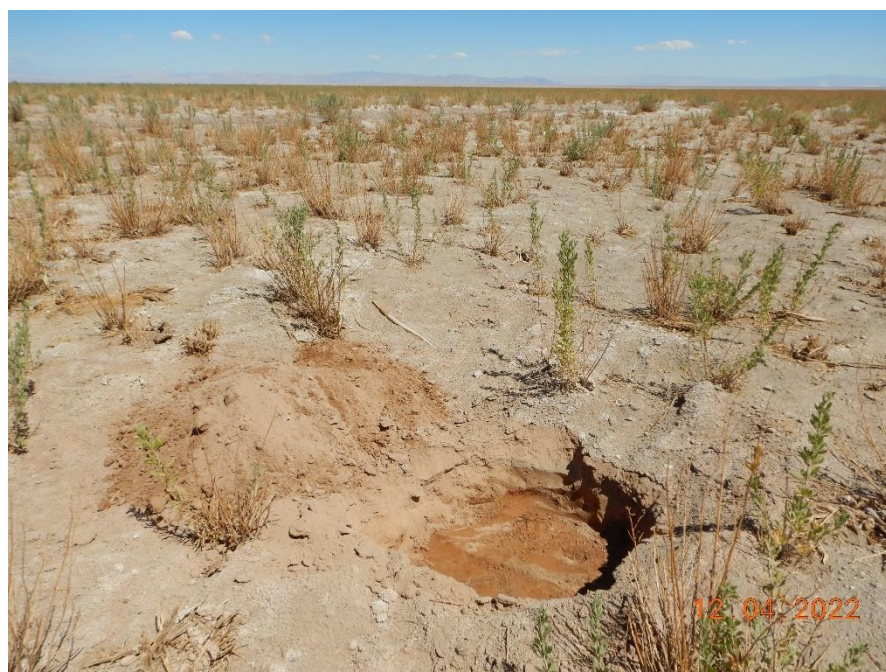
Figura 1-29. Fotografía punto de monitoreo L2-28 campaña Trimestre 2 año 2022.

Fuente: Registro Fotográfico terreno, abril 2022