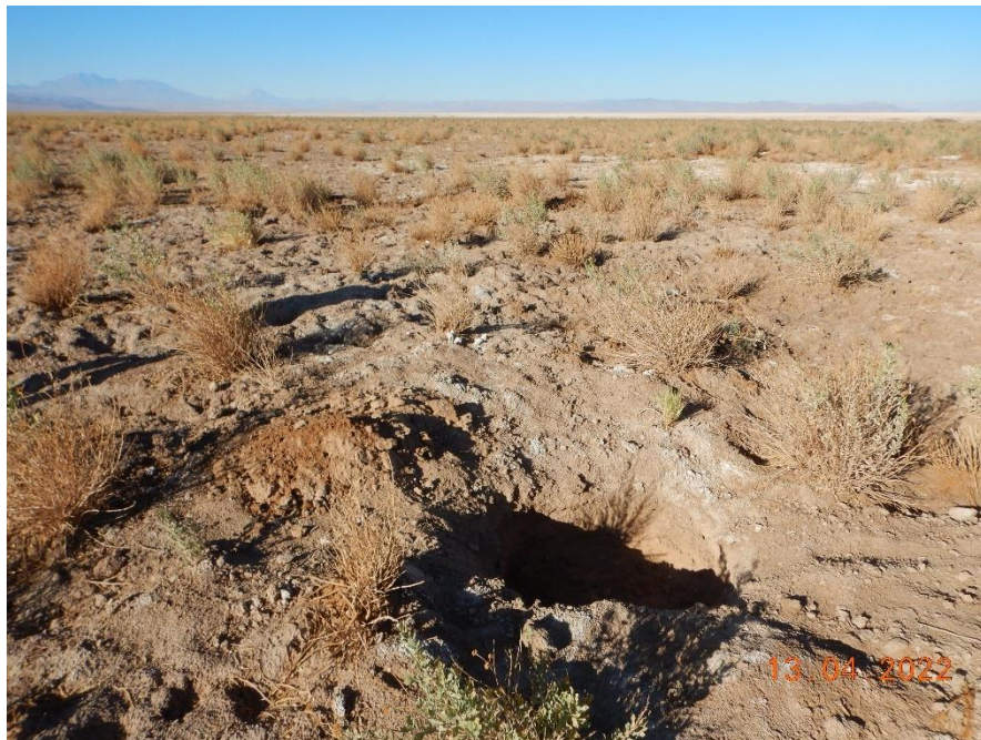
Figura 1-22. Fotografía punto de monitoreo L4-17 campaña Trimestre 2 año 2022.