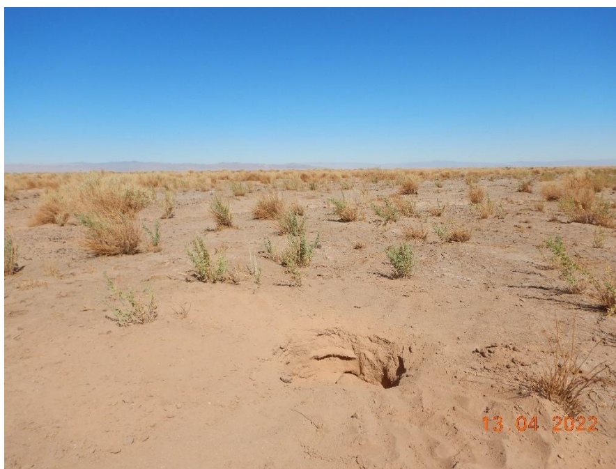
Figura 1-20. Fotografía punto de monitoreo L9-2 campaña Trimestre 2 año 2022.