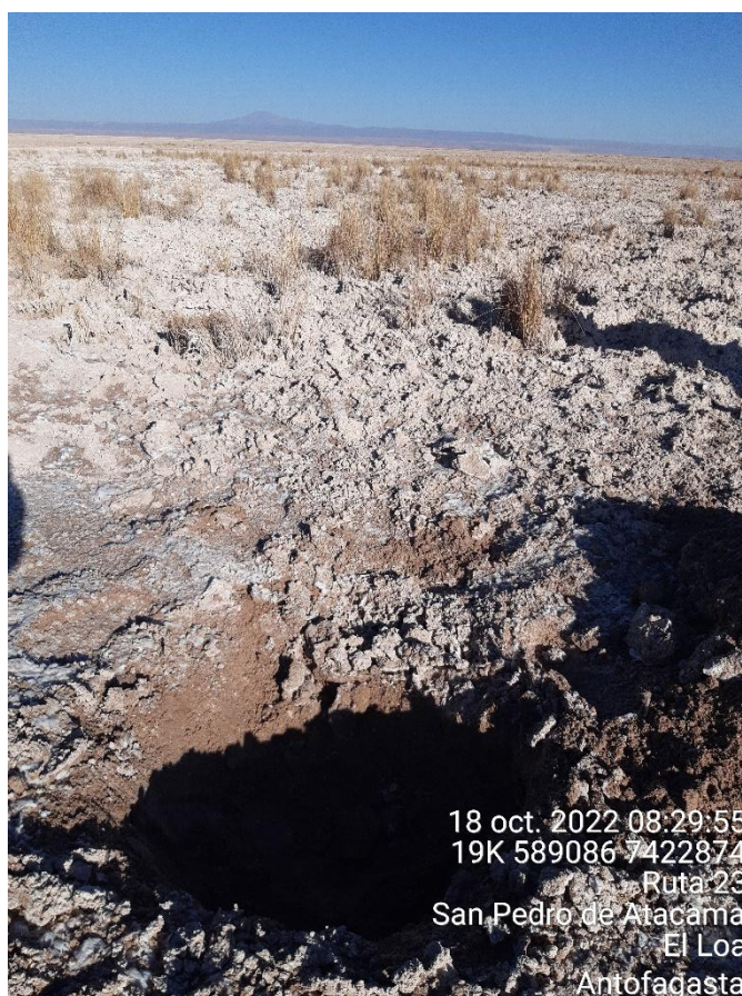
Figura 1-71. Fotografía punto de monitoreo L7-7 campaña Trimestre 4 año 2022.