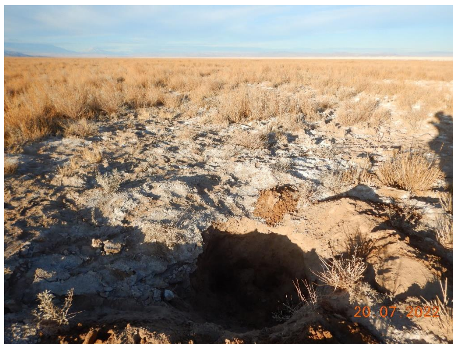
Figura 1-43. Fotografía punto de monitoreo L5-6 campaña Trimestre 3 año 2022.