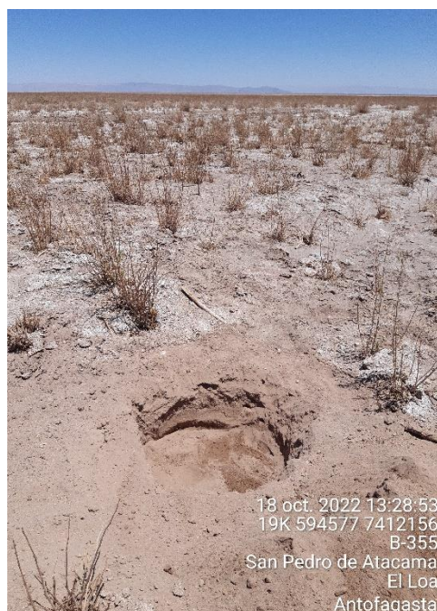
Figura 1-65. Fotografía punto de monitoreo L2-28 campaña Trimestre 4 año 2022.