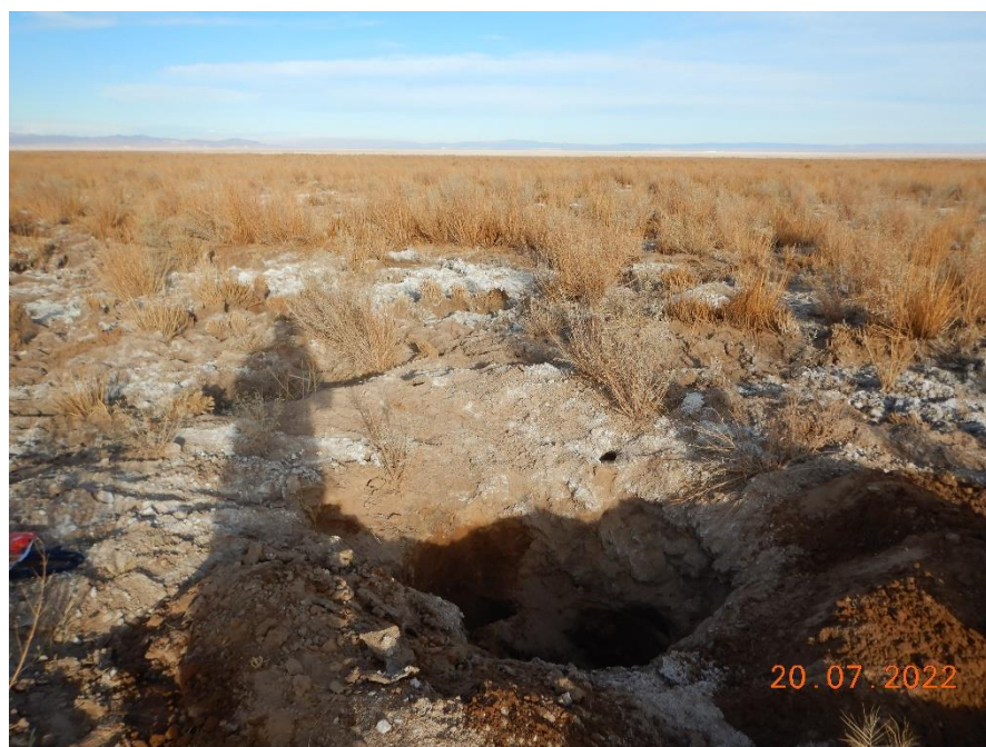
Figura 1-39. Fotografía punto de monitoreo L5-7 campaña Trimestre 3 año 2022.