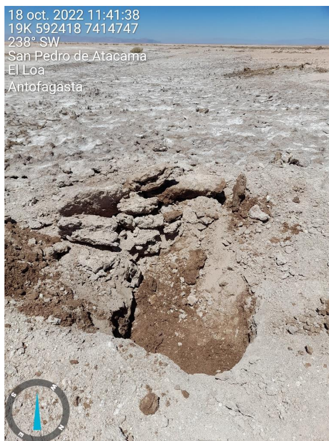
Figura 1-67. Fotografía punto de monitoreo L2-25 campaña Trimestre 4 año 2022.