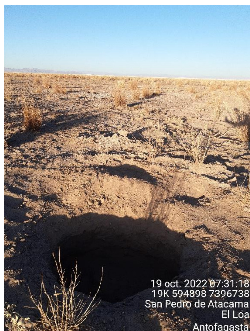
Figura 1-55. Fotografía punto de monitoreo L9-1 campaña Trimestre 4 año 2022.