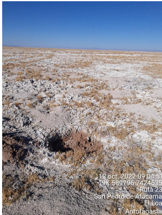
Figura 1-72. Fotografía punto de monitoreo 1027 campaña Trimestre 4 año 2022.