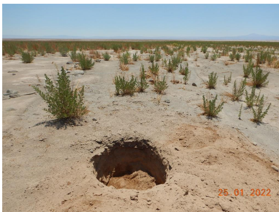
Figura 1-8. Fotografía punto de monitoreo L3-3 campaña Trimestre 1 año 2022.