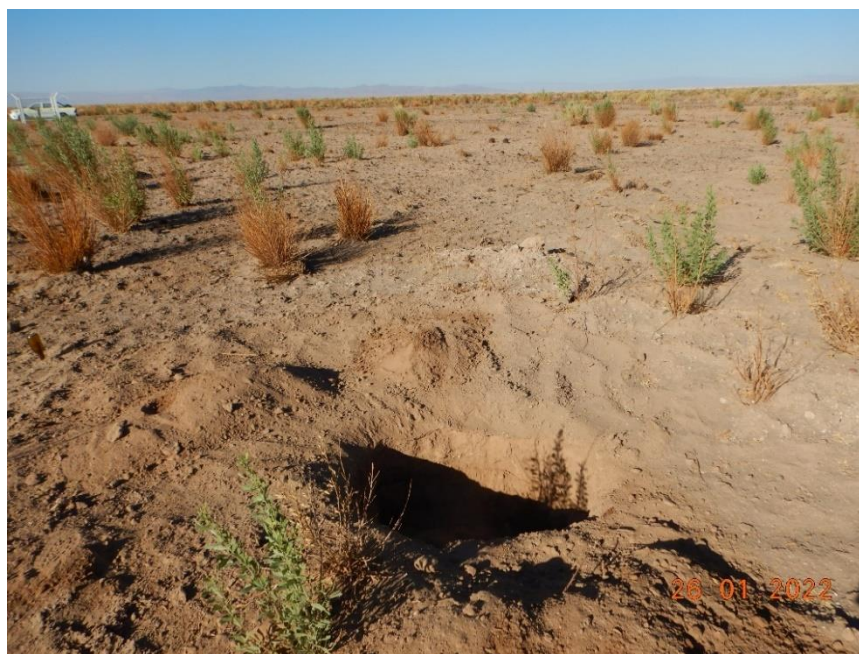
Figura 1-1. Fotografía punto de monitoreo L9-1 campaña Trimestre 1 año 2022