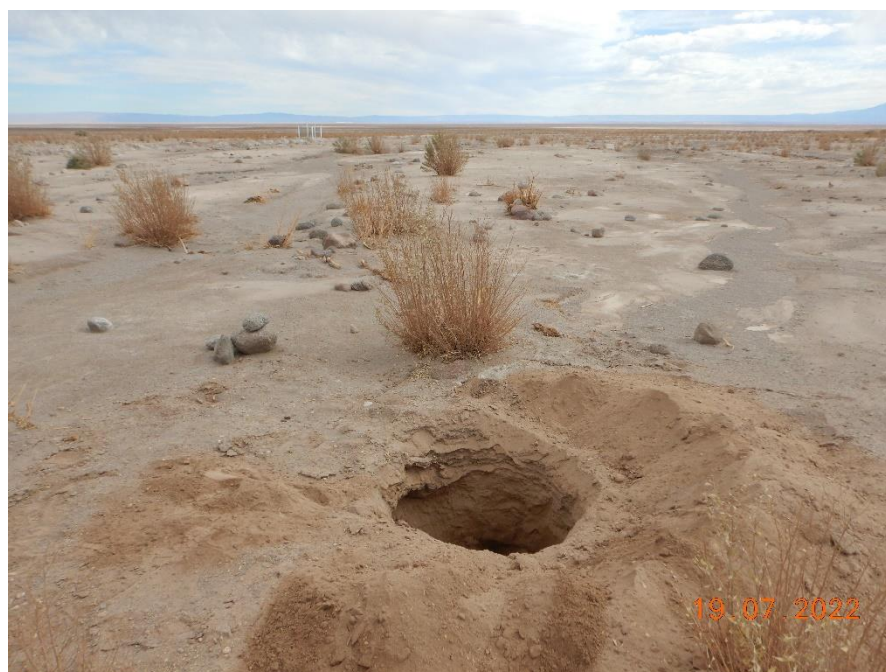
Figura 1-42. Fotografía punto de monitoreo L3-15 campaña Trimestre 3 año 2022.