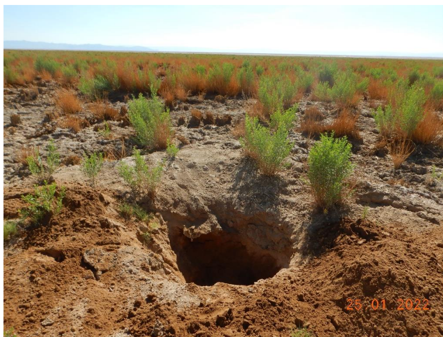
Figura 1-3. Fotografía punto de monitoreo L5-7 campaña Trimestre 1 año 2022.