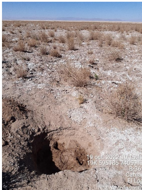
Figura 1-58. Fotografía punto de monitoreo L4-17 campaña Trimestre 4 año 2022.