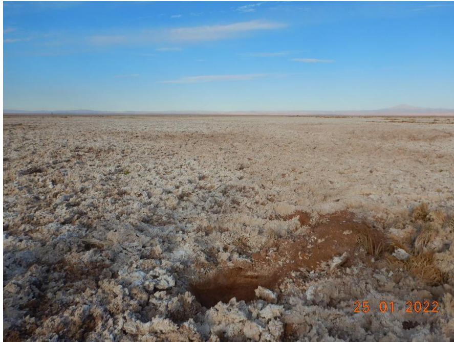
Figura 1-17. Fotografía punto de monitoreo L7-7 campaña Trimestre 1 año 2022.