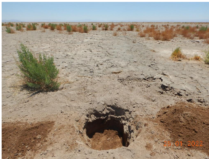
Figura 1-9. Fotografía punto de monitoreo L3-5 campaña Trimestre 1 año 2022.