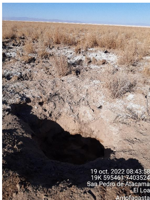
Figura 1-57. Fotografía punto de monitoreo L5-7 campaña Trimestre 4 año 2022.