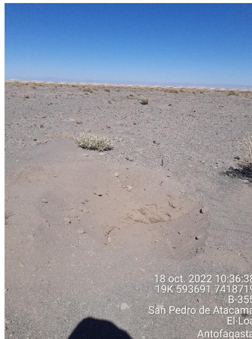
Figura 1-64. Fotografía punto de monitoreo L1-3 campaña Trimestre 4 año 2022.