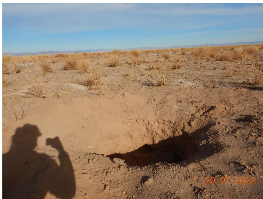
Figura 1-38. Fotografía punto de monitoreo L9-2 campaña Trimestre 3 año 2022.