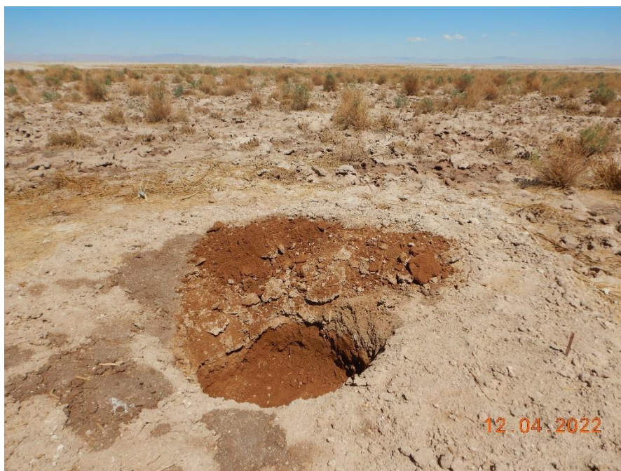
Figura 1-32. Fotografía punto de monitoreo L2-4 campaña Trimestre 2 año 2022.