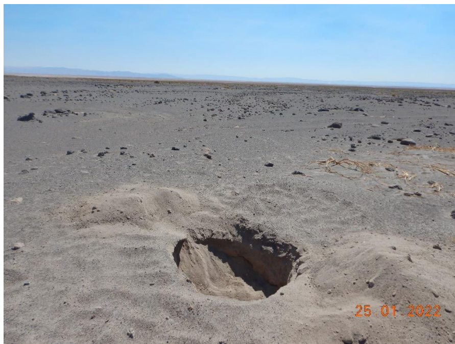
Figura 1-5. Fotografía punto de monitoreo L4-3 campaña Trimestre 1 año 2022.