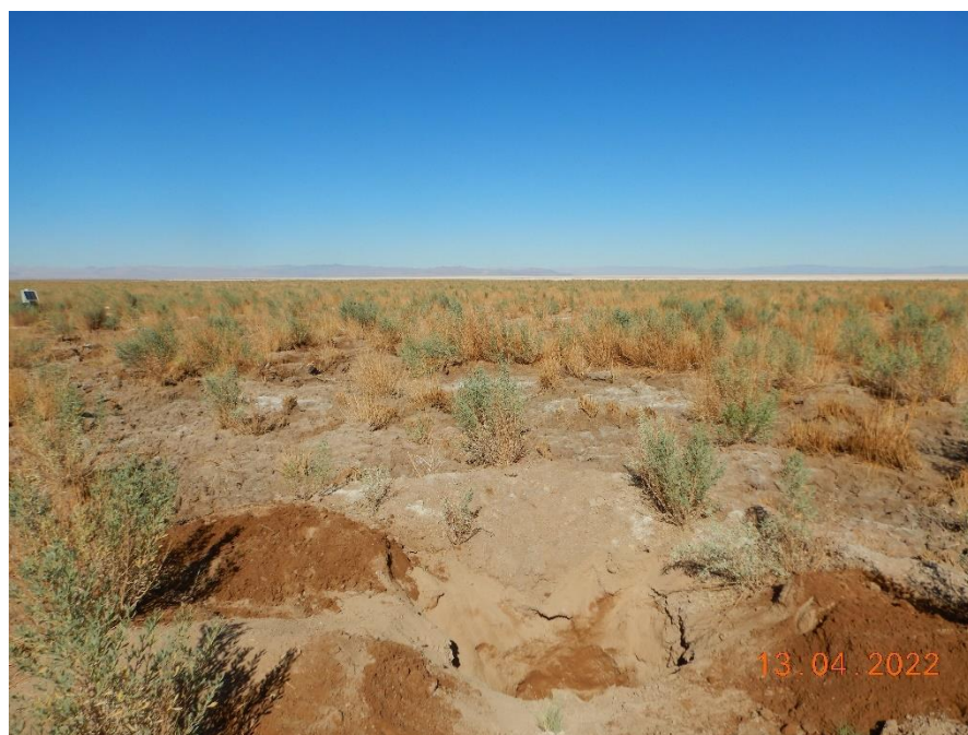
Figura 1-21. Fotografía punto de monitoreo L5-7 campaña Trimestre 2 año 2022.