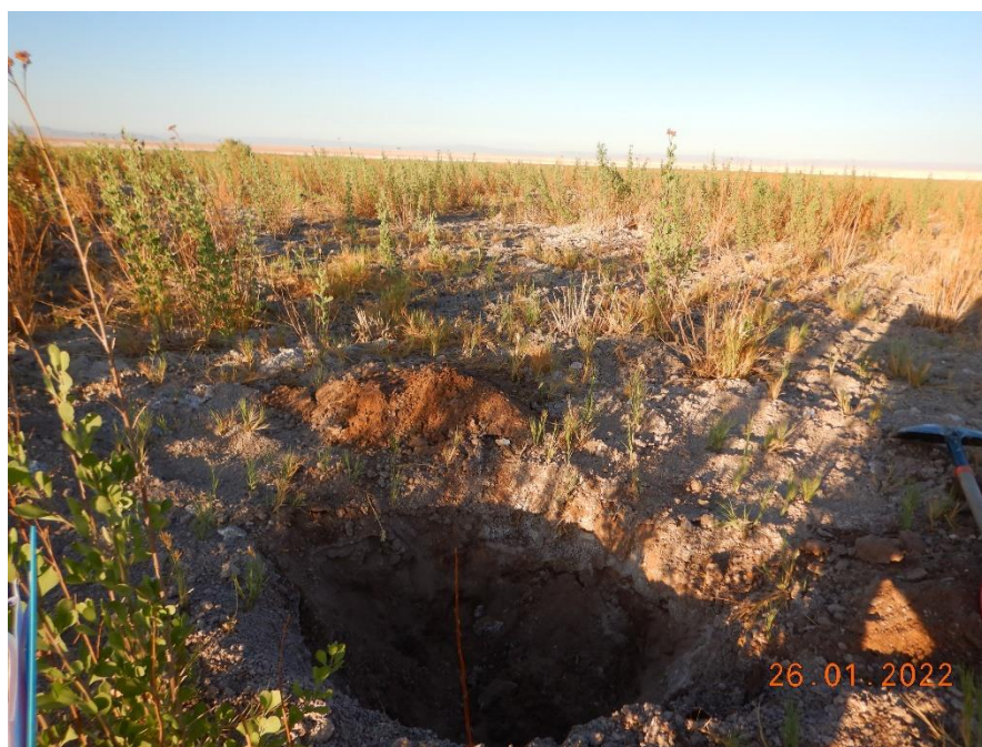
Figura 1-15. Fotografía punto de monitoreo L2-27 campaña Trimestre 1 año 2022.