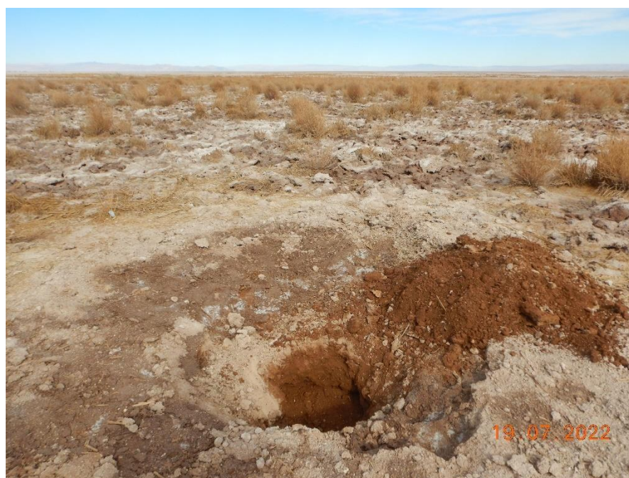
Figura 1-50. Fotografía punto de monitoreo L2-4 campaña Trimestre 3 año 2022.