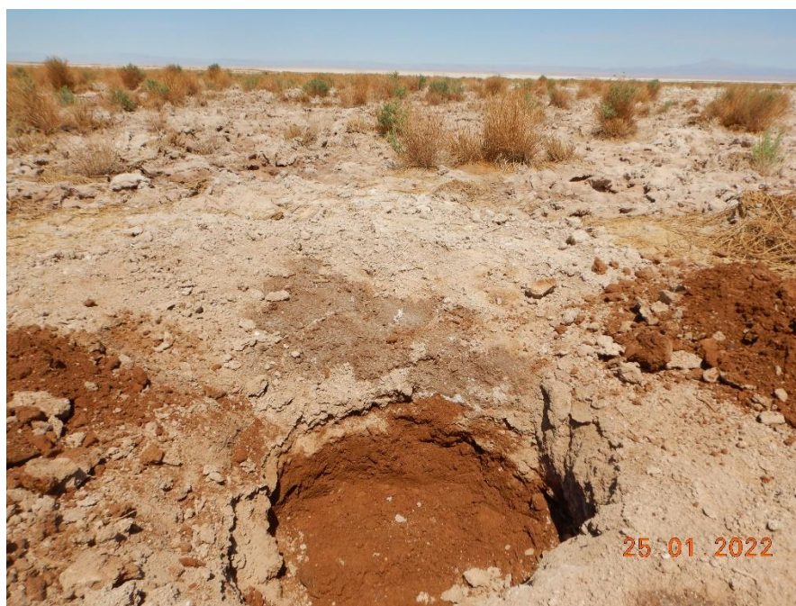
Figura 1-14. Fotografía punto de monitoreo L2-4 campaña Trimestre 1 año 2022.