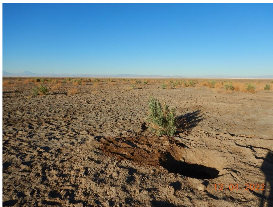
Figura 1-27. Fotografía punto de monitoreo L3-5 campaña Trimestre 2 año 2022.