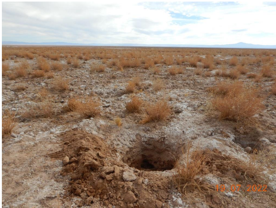
Figura 1-40. Fotografía punto de monitoreo L4-17 campaña Trimestre 3 año 2022.