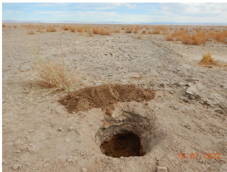
Figura 1-45. Fotografía punto de monitoreo L3-5 campaña Trimestre 3 año 2022.