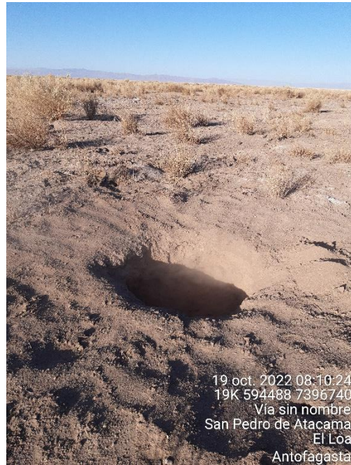
Figura 1-56. Fotografía punto de monitoreo L9-2 campaña Trimestre 4 año 2022.