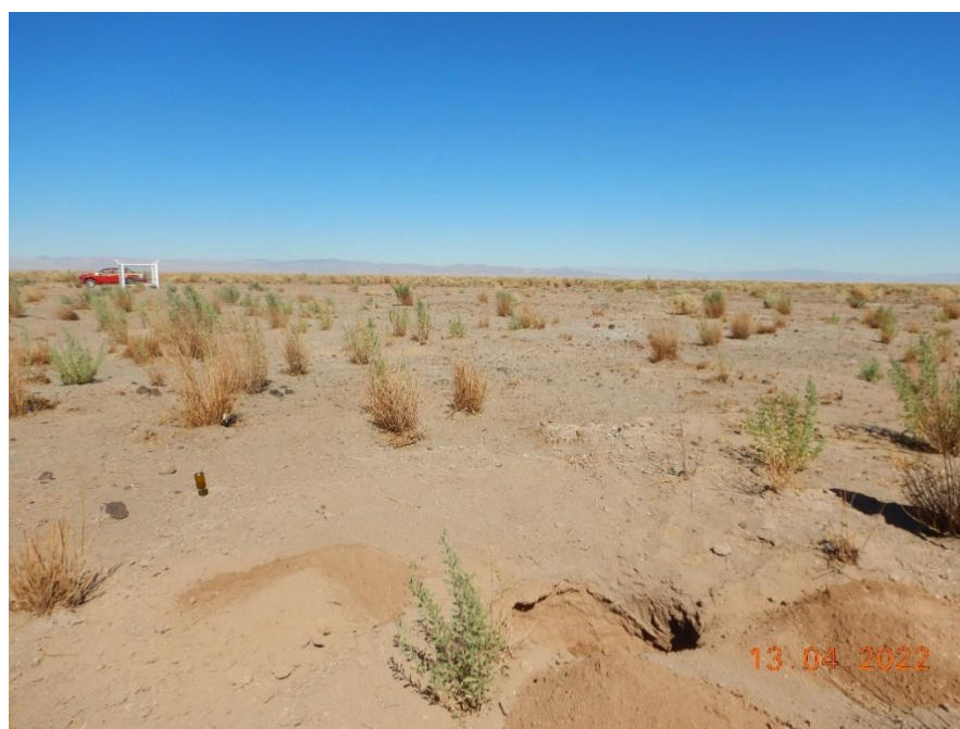
Figura 1-19. Fotografía punto de monitoreo L9-1 campaña Trimestre 2 año 2022.