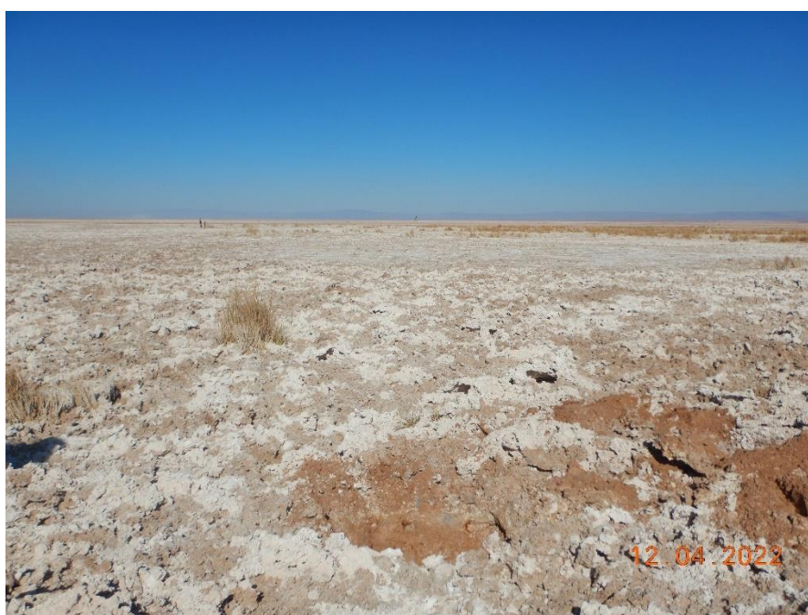
Figura 1-36. Fotografía punto de monitoreo 1027 campaña Trimestre 2 año 2022.