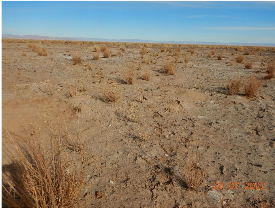
Figura 1-37. Fotografía punto de monitoreo L9-1 campaña Trimestre 3 año 2022.