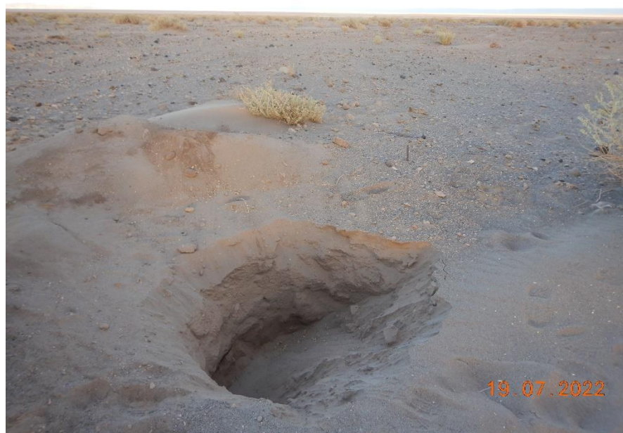
Figura 1-46. Fotografía punto de monitoreo L1-3 campaña Trimestre 3 año 2022.