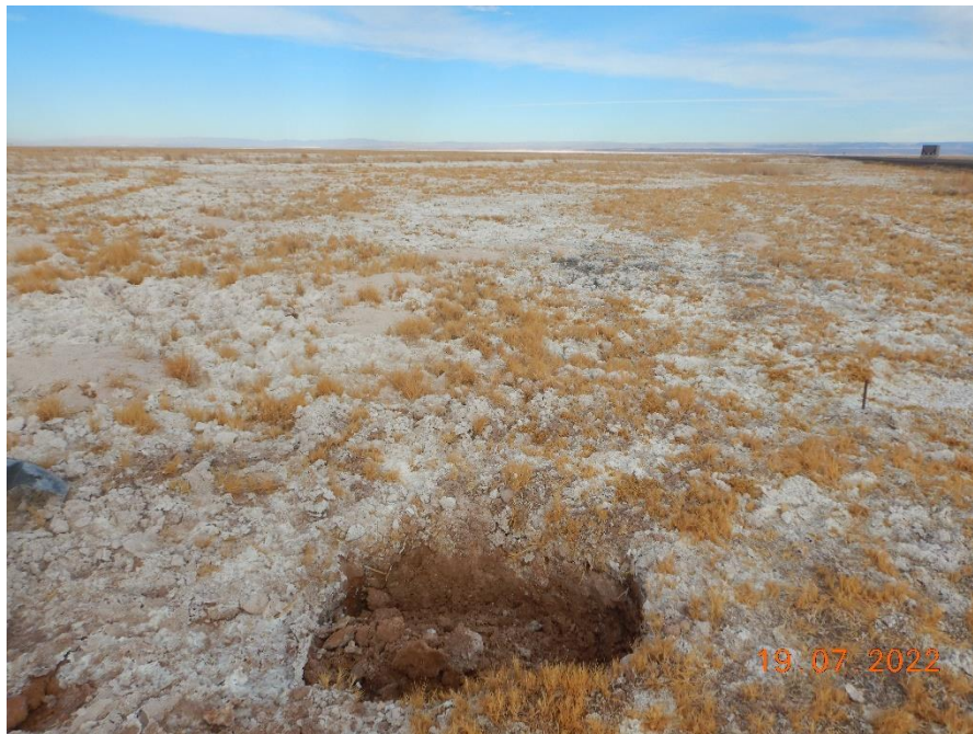
Figura 1-53. Fotografía punto de monitoreo L7-7 campaña Trimestre 3 año 2022.