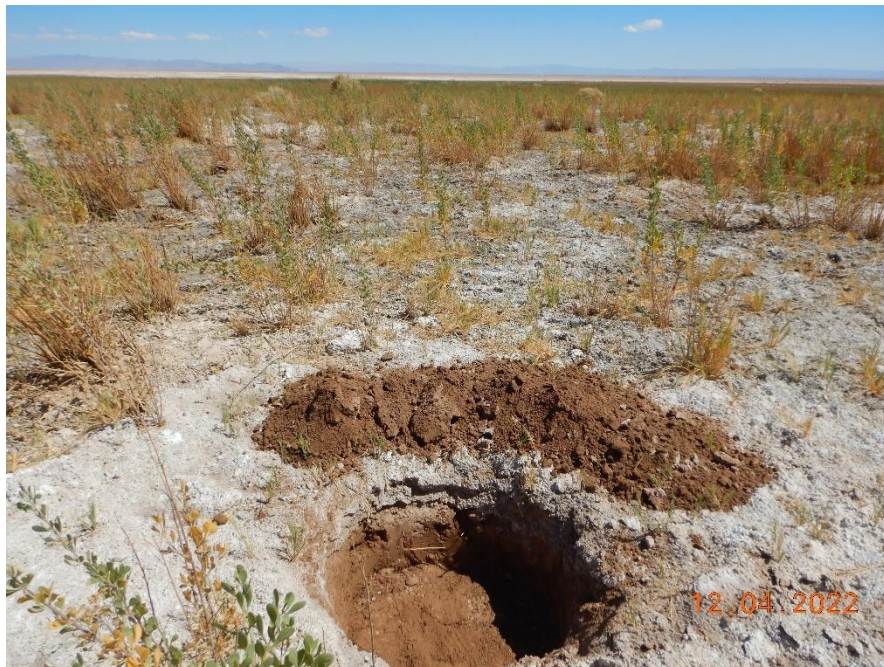
Figura 1-33. Fotografía punto de monitoreo L2-27 campaña Trimestre 2 año 2022.