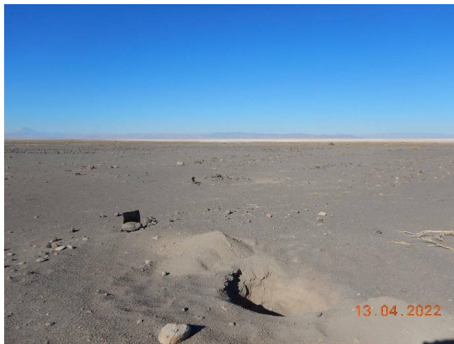
Figura 1-23. Fotografía punto de monitoreo L4-3 campaña Trimestre 2 año 2022.