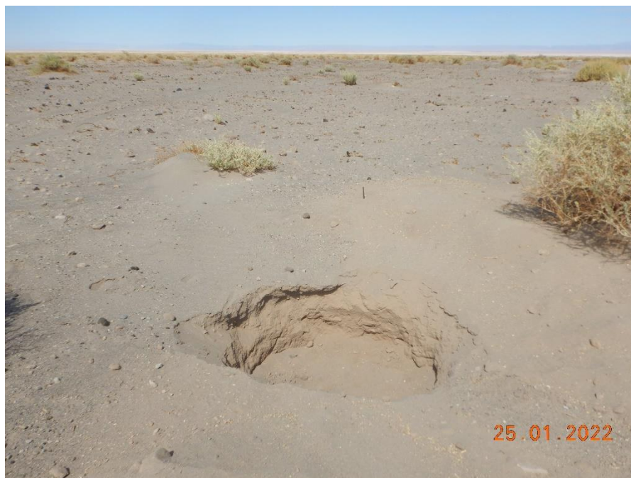
Figura 1-10. Fotografía punto de monitoreo L1-3 campaña Trimestre 1 año 2022.