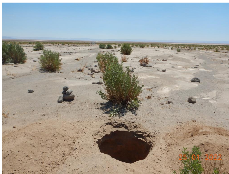
Figura 1-6. Fotografía punto de monitoreo L3-15 campaña Trimestre 1 año 2022.