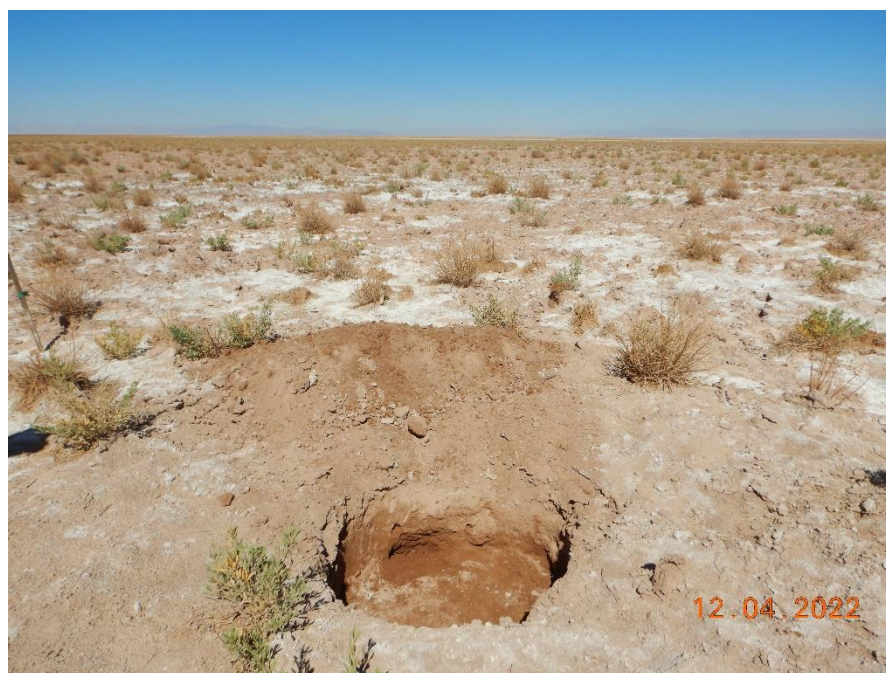
Figura 1-34. Fotografía punto de monitoreo L7-14 campaña Trimestre 2 año 2022.