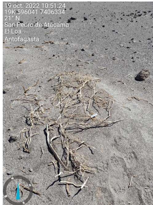
Figura 1-59. Fotografía punto de monitoreo L4-3 campaña Trimestre 4 año 2022.