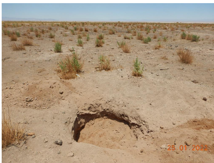
Figura 1-12. Fotografía punto de monitoreo L2-26 campaña Trimestre 1 año 2022.