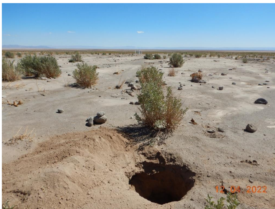
Figura 1-24. Fotografía punto de monitoreo L3-15 campaña Trimestre 2 año 2022.