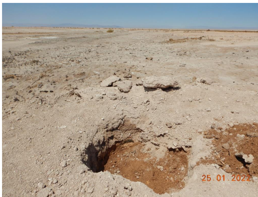
Figura 1-13. Fotografía punto de monitoreo L2-25 campaña Trimestre 1 año 2022.