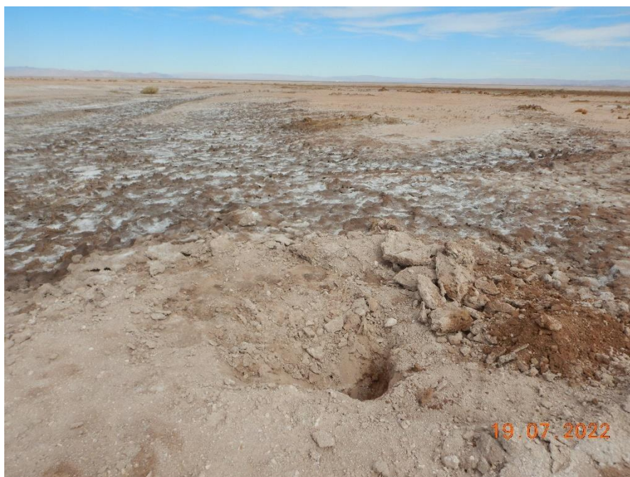
Figura 1-49. Fotografía punto de monitoreo L2-25 campaña Trimestre 3 año 2022.