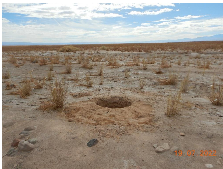
Figura 1-44. Fotografía punto de monitoreo L3-3 campaña Trimestre 3 año 2022.

Fuente: Registro Fotográfico terreno, julio 2022